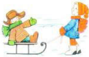
Саня катает Тараса на санках.