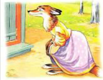
У лисы красные бусы.