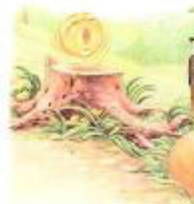
Колобок в лесу пет