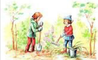
Раиса и Алиса посадили цветы.