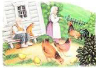
София кормит петуха просом.