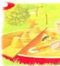
София ситком паша.