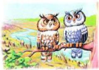
На сухом суку сидят совы.